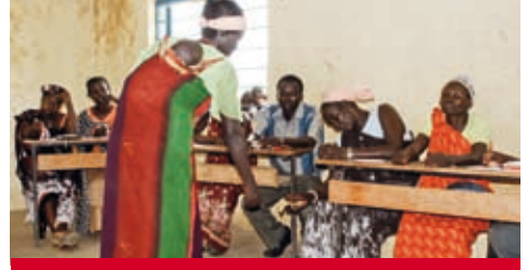
Südsudan: Erfolgreiche Spargruppen bauen gemeinsam an der Zukunft.

Die Millenniumsentwicklungsziele (MDG) sind nach wie vor ein Markstein der internationalen Zusammenarbeit, wodurch wichtige Initiativen lanciert wurden. Allein die Tatsache, dass sich die Weltgemeinschaft im Jahr 2000 geeinigt hat, bis 2015 gemeinsam die Situation der Ärmsten zu verbessern, ist eine Erfolgsgeschichte. Die MDG repräsentieren Grundbedürfnisse und Grundrechte, die für alle Menschen gelten: keine chronische Armut oder Hunger, eine qualitativ gute Schulbildung, Gesundheitsvorsorge und eine sichere Unterkunft, das Recht für Frauen zu gebären, ohne ihr Leben zu riskieren, gleiche Rechte und Lebensbedingungen für Frauen und Männer und eine Welt, die mit natürlichen Ressourcen nachhaltig umgeht. Eine globale Partnerschaft in der internationalen Zusammenarbeit soll das Erreichen der Ziele sichern.