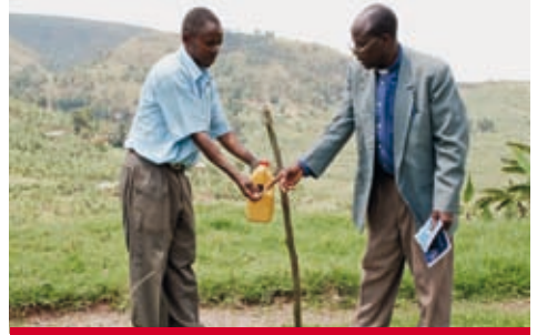
Uganda: Händewaschen ist wichtig, gute Instruktion ebenfalls.

heitsstatus hat zur Folge, dass der Aufwand für die Pflege von erkrankten Menschen geringer ist als in den Jahren davor. Wirksamkeit und Verträglichkeit dieser Medikamente bedingen jedoch eine ausgewogene und regelmässige Ernährung der Betroffenen. Deshalb wurde besonders im Bereich Ernährungssicherung investiert. 5'140 Menschen wurden durch das integrierte HIV/Aids-Projekt begünstigt.