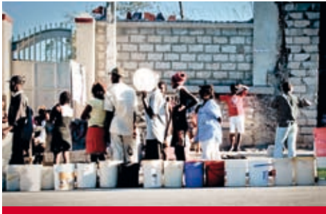
Haiti: Für Wasser mussten Menschen stundenlang anstehen.