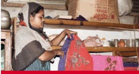
Bangladesch: Aus den eigenen Fähigkeiten etwas machen.