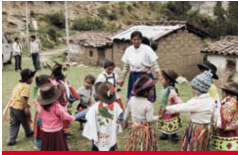
Peru: Kulturelles Erbe wird an der Schule gefördert.