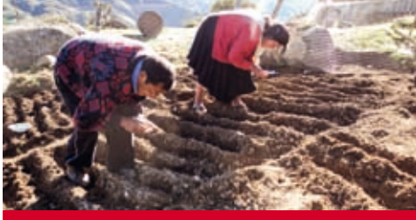
Peru: Ausgewogene Ernährung durch angepasste Anbaumethoden.