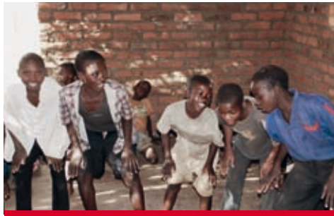
Malawi: Jugendgruppen sind ein wichtiges Gefäß für Prävention.