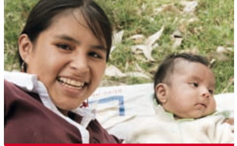
Peru: Dank Rehabilitation das Lachen wieder gewinnen.

In Peru kämpft TearFund nun schon seit acht Jahren gemeinsam mit der Partnerorganisation Paz y Esperanza Huánuco gegen sexuellen Missbrauch und häusliche Gewalt an Frauen. Im Berichtsjahr konnten in der Provinz Pachitea über 1'000 Sekundarschülerinnen und Schüler, acht Jugendgruppen, Lehr-