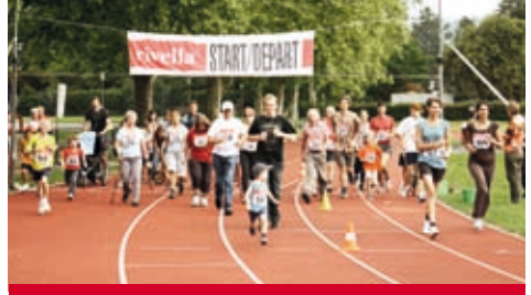
Schaffhausen: Sportliches Engagement.

Das Jahresmotto im Titel kam 2010 hauptsächlich am Christustag, aber auch an Vorträgen und dem Gruppeneinsatz in Uganda zum Tragen. Mit dem Afrikalauf startete der neue Kommunikationsschwerpunkt, der bis Ende 2011 den Auftritt von TearFund mitprägen wird: Waisen und benachteiligte Familien in Sambia.