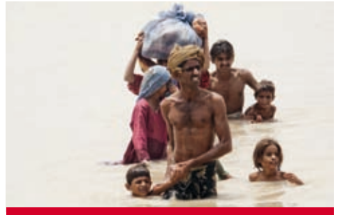
Pakistan: Existenzen wurden weggeschwemmt.