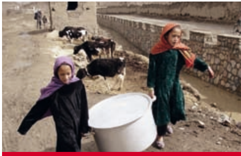
Afghanistan: Gesundheitsprojekt litt unter schwieriger Sicherheitslage.