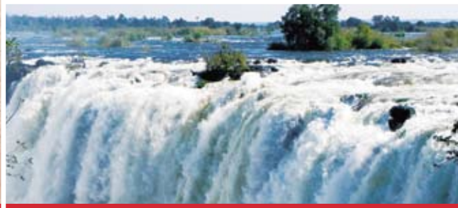
oder Erlebnisreise nach Sambia?

Was Aurelius Augustinus schon vor gut 1500 Jahren wusste, ist auch heute noch wahr. Reisen eröffnet neue Sichtweisen, erweitert den Horizont und bringt einem zum Staunen. Grund genug, sich auf dieses Abenteuer einzulassen! Im nächsten Jahr bietet Ihnen TearFund zwei ganz unterschiedliche Reisen nach Afrika an.