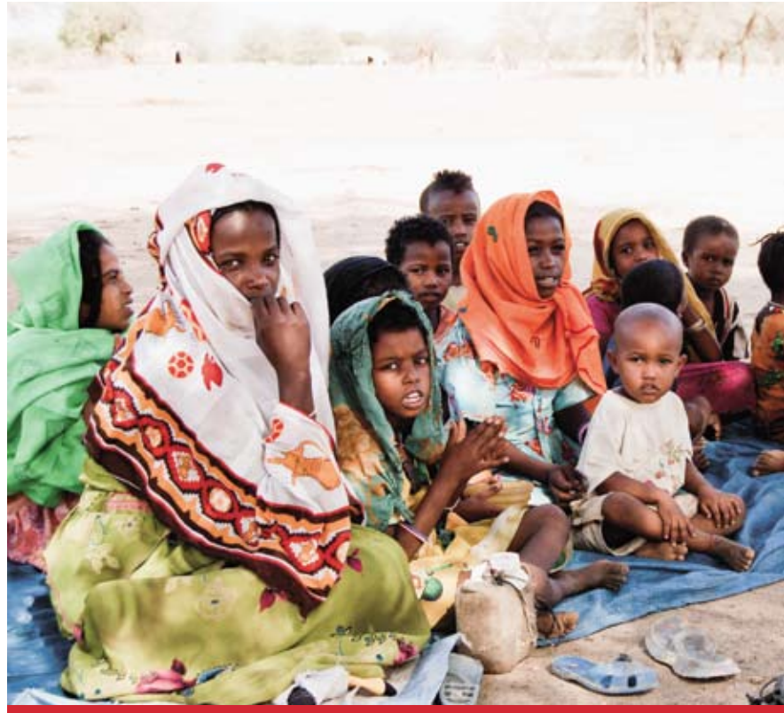
Krise in Darfur: Besonders betroffen sind Kinder

Der bereits achtjährige Konflikt in Darfur (Sudan) ist eine der schlimmsten humanitären Krisen weltweit, die nach Schätzungen der UNO bisher 300'000 Opfer forderte. Rund 2,7 Millionen Menschen mussten fliehen und leben heute mehrheitlich in Camps für intern vertriebene Menschen. Seit Dezember 2010 hat die Anzahl der intern vertriebenen Menschen schätzungsweise um weitere 140'000 zugenommen.