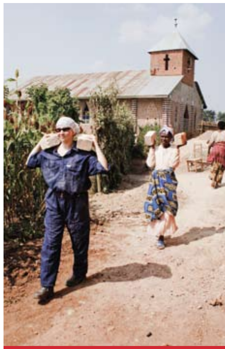
Einsatz in Uganda...