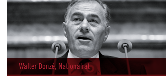
Walter Donzé, Nationalrat

«Als Projekt-Pate begegne ich benachteiligten Menschen auf Augenhöhe. Mein Beitrag wird nicht ausgegeben, sondern investiert. Ich engagiere mich für TearFund Schweiz, weil ihre Projekte die Sicherheit und Würde von benachteiligten Menschen anstreben.»