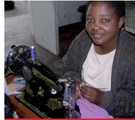
Hilfe zur Selbsthilfe: Mikrokredite verändern das Leben von benachteiligten Familien in Sambia.