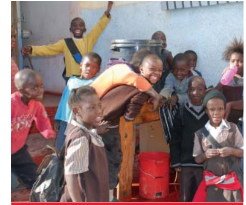
Bildung ist entscheidend, damit Kinder in Sambia eine Chance für eine bessere Zukunft haben.