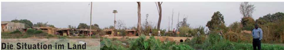
Die Situation im Land